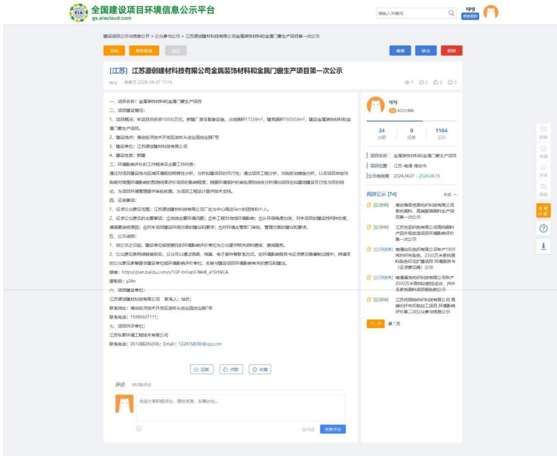
图 3.2-1 建设项目第一次公示截图