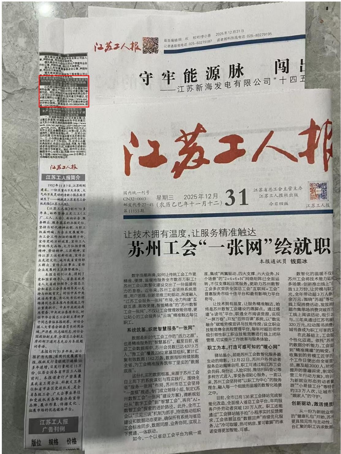
图 3.2-4 建设项目二次报纸公开截图