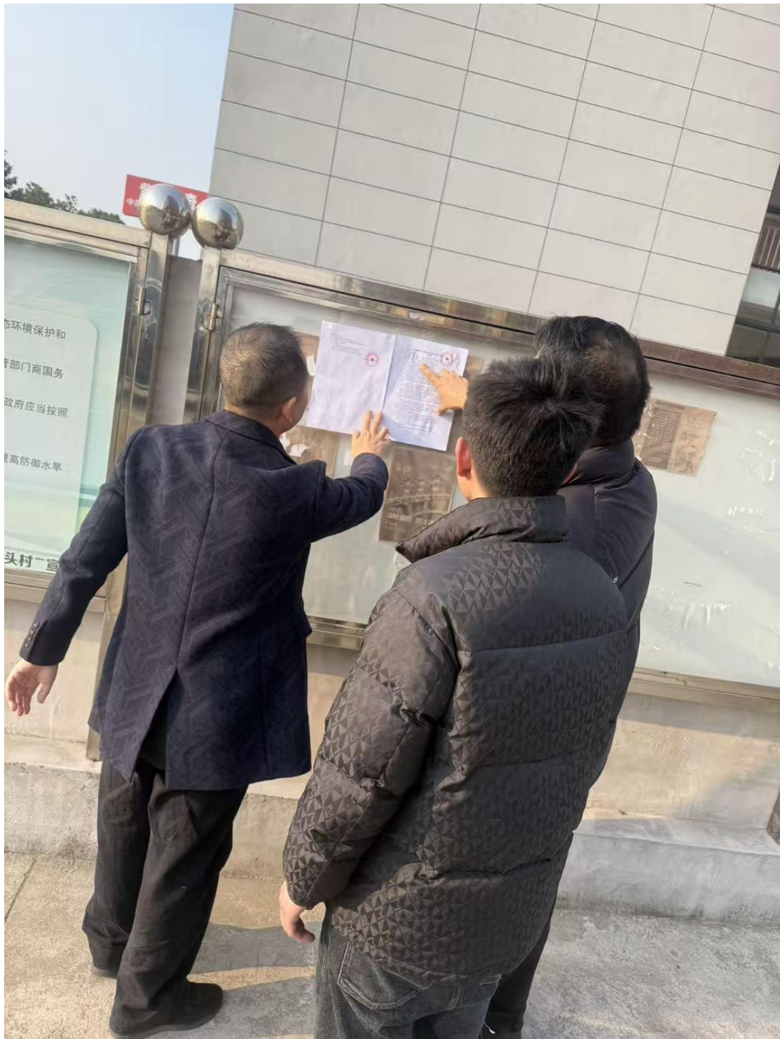
图 3.2-6 现场公示图