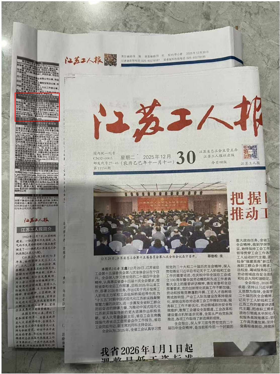
图 3.2-3 建设项目一次报纸公开截图